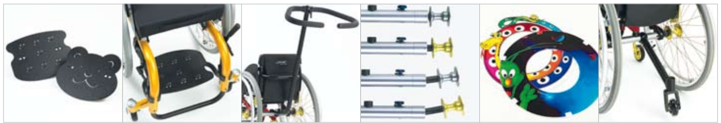
Fussplatten „Smiley“ und „Teddy“